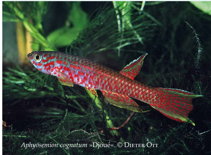
Aphyosemion cognatum »Djoué«.

Holen Sie sich unser Gesamtverzeichnis als PDF unter www.neuebrehm.de/downloads