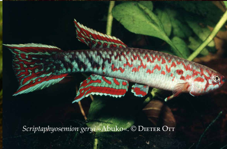
Scriptaphyosemion geryi »Abuko«.