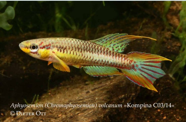
Aphyosemion (Chromaphyosemion) volcanum »Kompina C03/14«