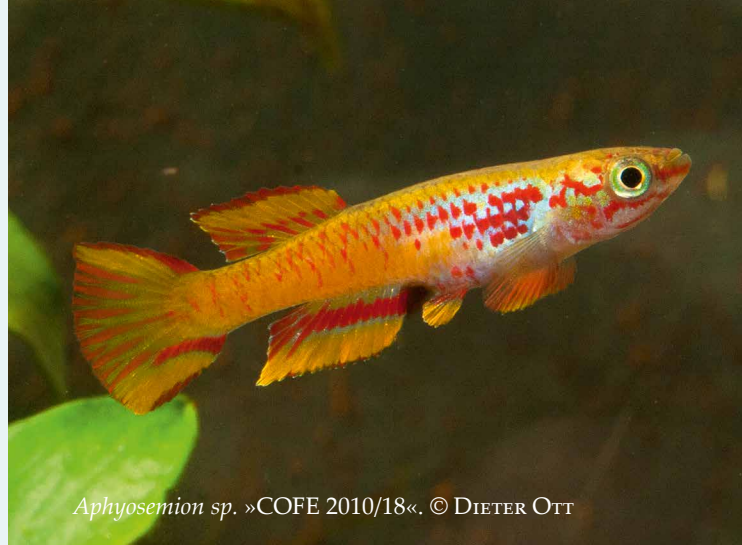
Aphyosemion sp. »COFE 2010/18«.

Jahrgang 1948, ehemaliger Bankkaufmann und Versicherungsfachwirt, pflegt und züchtet Aquarienfische seit seiner frühesten Jugend. Mit der ersten Spiegelreflexkamera begann er, die Insassen seiner Aquarien zu porträtieren. Seit 40 Jahren beschäftigt er sich intensiv mit afrikanischen und südamerikanischen Killifischen. In Fachpublikationen und Vorträgen gab und gibt er sein Wissen im Kreis der Aquarianer weiter.