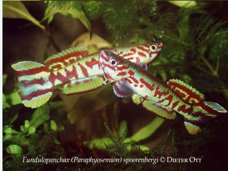
Fundulopanchax (Paraphyosemion) sporensbergi © DIETER OTT